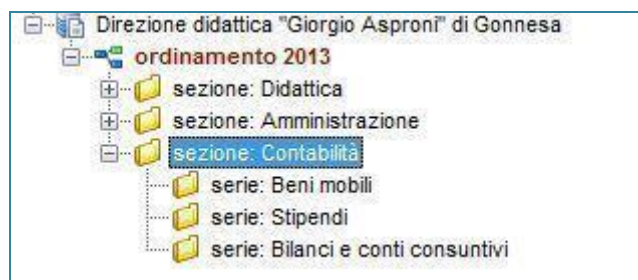
Figura 3: Articolazione logica della Sezione Contabilità

Ogni unità è stata identificata da una numerazione per collocazione che ne indica la posizione fisica sugli scaffali e da una numerazione logica, per "serie aperte". Ogni serie riparte infatti dal numero 1, essendo il soggetto produttore ancora attivo e quindi l'archivio ancora suscettibile di incrementi.