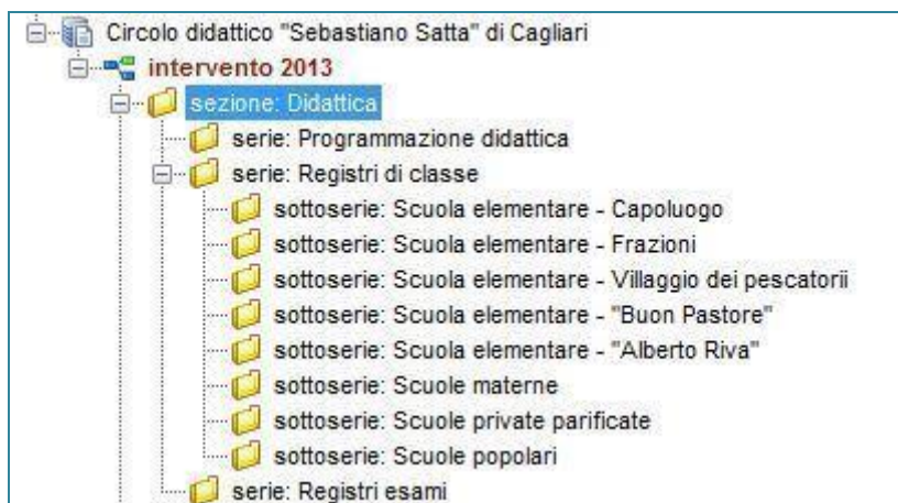
Figura 1: articolazione Sezione Didattica