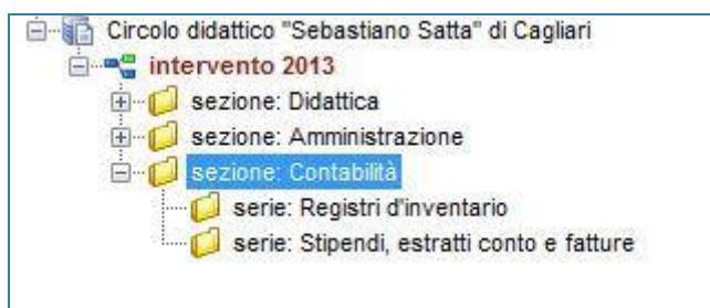
Figura 4: articolazione Sezione Contabilità

Per alcune serie/sottoserie, la descrizione archivistica corrisponde al livello del raggruppamento di unità. Tutti questi casi sono segnalati dalla specifica avvertenza "livello della descrizione: raggruppamento di unità archivistiche", inserita nella rispettiva scheda descrittiva della serie/sottoserie a cui si riferisce. In tutti questi casi, la scheda riferita al raggruppamento contiene l'indicazione del tipo e della consistenza delle unità archivistiche che costituiscono il raggruppamento.